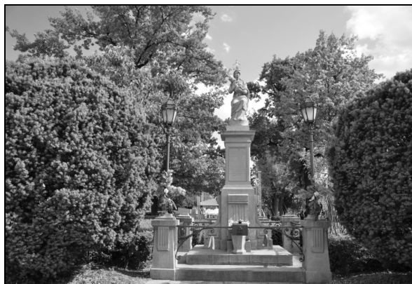
Fot. 2. Kapliczka Matki Bożej Passawskiej, stan obecny.

Pojedyncze kapliczki lokowano także wzdłuż innych traktów dojazdowych do miasta. Od zachodniej strony, na Woli ustawiano liczne kapliczki przy gościńcu (obecnie ulice Wolska i Górczewska, wzdłuż których dziś stoi kilka kapliczek przydrożnych), ale też przy drodze prowadzącej na pola elekcyjne Woli. Do dziś zachowała się kapliczka datowana na 1868 rok, stojąca na tle bloków mieszkalnych przy ulicy Elekcyjnej. Także na gościńcu piaseczyńskim (obecnie ulica Puławska) znajdowało się wiele kapliczek. Najstarsza zachowana do dziś pochodzi z końca XIX w. Kapliczki stawiano także w obrębie miasta. Jedną z najstarszych jest kapliczka wotywna Matki Bożej Passawskiej z 1683 r. Figurę Matki Bożej wykonał Józef Szymon Belotti, nadworny architekt króla Michała Korybuta Wiśniowieckiego i później Jana III Sobieskiego wzorując się na obrazie Matki Boskiej Wspomożenia Lucasa Cranacha Starszego z około 1540r. Belotti ufundował tę kapliczkę jako podwójne wotum wdzięczności. Najpierw za uratowanie jego rodziny od zarazy czarnej ospy, która nawiedziła Warszawę w 1677 r., a później także jako osobisty dar dla Króla Jana III Sobieskiego będący wyrazem wdzięczności za wiktoryę wiedeńską (fot. 2). Z inicjatywy Józefa Wandalina Mniszcha i jego żony Konstancji w 1733 r. wzniesiona została kapliczka św. Jana Nepomucena, którą ustawiono przed bramą pałacu fundatorów (obecnie ulica Senatorska). Kapliczka ta zachowała się do dnia dzisiejszego (fot. 3).