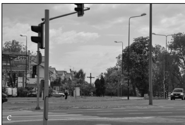
Fot. 5a, b, c. Kapliczki na skrzyżowaniu dróg. Photo 5a, b, c. Shrines of the crossroads.