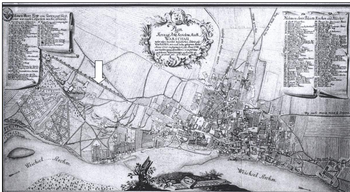
Ryc. 1. Kalwaria Ujazdowska na planie Warszawy Hübnera z 1740 r.

Kapliczki obecne były w krajobrazie Warszawy od najdawniejszych czasów. Lokalizowano je przede wszystkim wzdłuż głównych gościńców dojazdowych do miasta, na skraju przydrożnych wiosek i osad, przy przeprawach przez Wisłę (Sobieszczański, 1857). Założeniem sakralnym na skalę urbanistyczną była droga krzyżowa założona na fragmencie najstarszego gościńca z Czerska do Warszawy (ryc. 1).