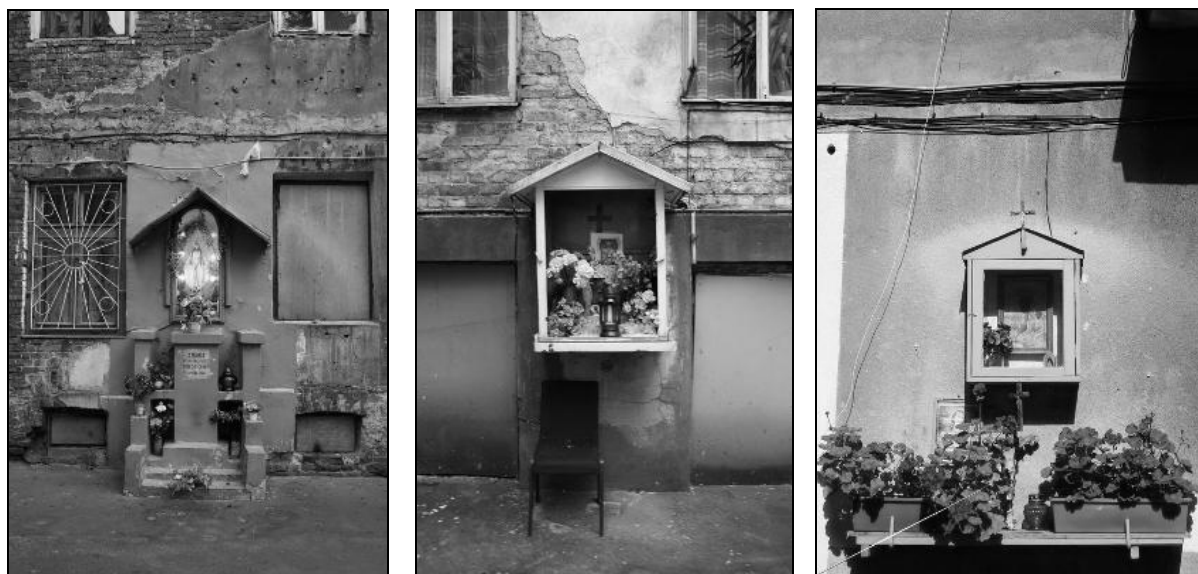
Fot. 4. Kapliczki na warszawskiej Pradze, stan współczesny. Photo 4. Shrines in Warsaw (Praga district), contemporary state.

w sąsiedztwie domów mieszkalnych, na podwórkach, parkanach czy ścianach domów (Bohdziewicz, Stopa, 2011). Były skromne, często niepozorne, umieszczone tak, że wtapiały się w otoczenie i trudno było je zauważyć od razu. Do dnia dzisiejszego tego typu kapliczki zachowały się w śródmieściu Warszawy, w tak zwanych podwórkach studniach oraz na Pradze, gdzie i obecnie stanowią wyróżnik praskiego krajobrazu zabudowy osiedlowej, a zwłaszcza przedwojennych podwórek (fot. 4).