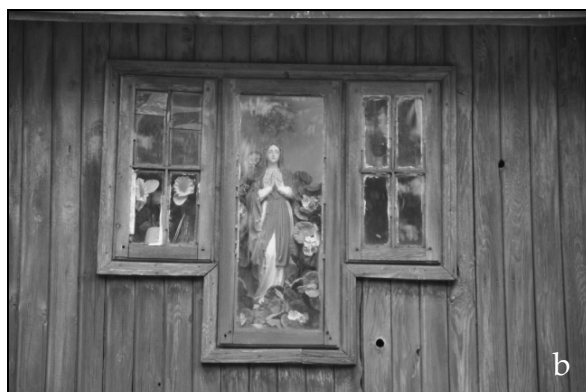
Fot. 6. a) Krzyż u wejścia do rezerwatu Skarpa Ursynowska, b) Kapliczka na domu przy ulicy Nowoursynowskiej. Photo 6. a) The cross at the entrance to the reserve Ursynowska Escarpment, b) The shrine at the house in Nowoursynowska street.