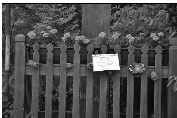
Fot. 7. Zawieszona na kapliczce informacja o nabożeństwie majowym, w którym uczestniczyć będzie także proboszcz parafii. Photo 7. Information about May celebration which will involve the parish, hanging on the shrine.