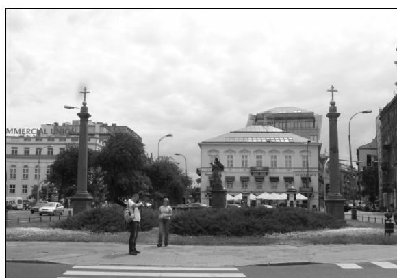
Fot. 1. Dwa obeliski na początku dawnej Kalwarii Ujazdowskiej, stan współczesny.

Fundatorami drogi krzyżowej, zwanej też Kalwarią Ujazdowską byli August II Mocny i August III Sas. Projekt wykonał królewski architekt Joachim Daniel Jauch, a prace prowadzone były w latach 1724-1731. Droga Krzyżowa rozpoczynała się w miejscu obecnego placu Trzech Krzyży. Jej początek wyznaczały dwa kamienne obeliski zwieńczone krzyżami pasyjnymi, ustawione po obu stronach drogi (fot. 1). 28 kaplic drogi krzyżowej rozmieszczonych było wzdłuż drogi (obecna aleja Ujazdowska) biegnącej w kierunku zamku Ujazdowskiego. Ostatnia kaplica Grobu Pańskiego była