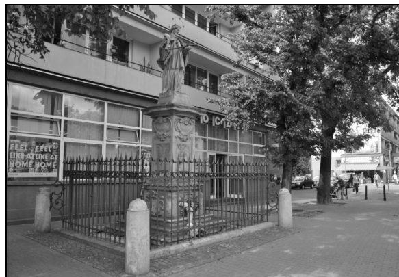
Fot. 3. Kapliczka św. Jana Nepomucena przy ulicy Senatorskiej, stan obecny.

Photo 2. Roadside shrine of Matka Boża Passawska, contemporary state.