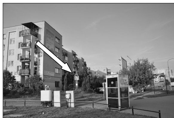
Fot. 8. Współczesny kontekst krajobrazowy przydrożnych kapliczek Ursynowa.

Photo 8. Contemporary landscape context of roadside shrines in Ursynów district.